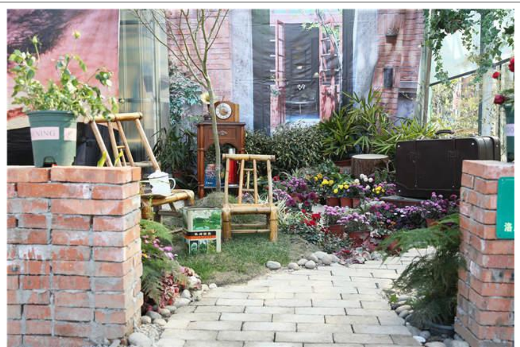
弈园、竹韵园、荷塘月色、染尽铅华、茶风、玉门春风……日前,由生态学院学生精心设计的17个中式小花园亮相校园,吸引了众人的目光。图为作品《屋里乡》,让观众在海派小花园里品味“流金岁月”。