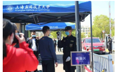
进入学校先测体温

为扎实做好线下开学返校准备工作,保障教学科研各项工作有序运行,4月28日下午,学校在奉贤校区举行开学返校准备演练活动,实地检测疫情防控形势下各项预案落实与应急处置能力。