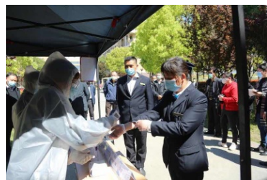
物业人员上岗前测量体温