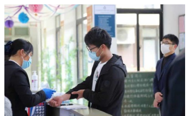
进寝室前也必须进行体温测量